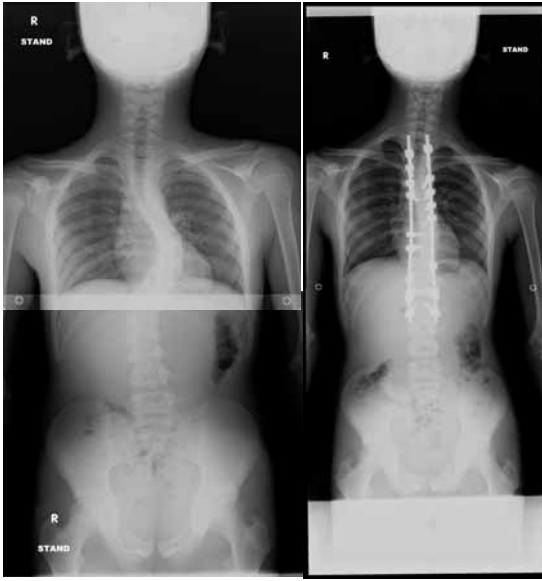
麻痺性側彎症に対する脊椎矯正固定術