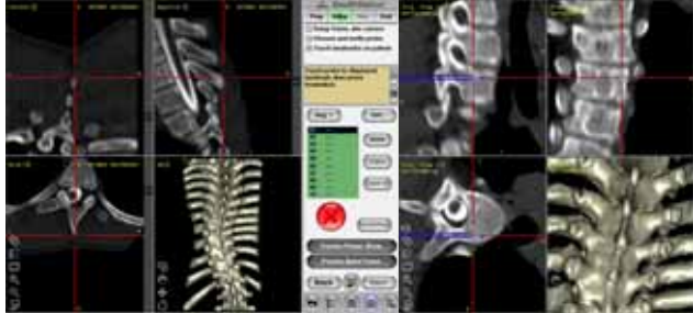
ナビゲーション使用した手術